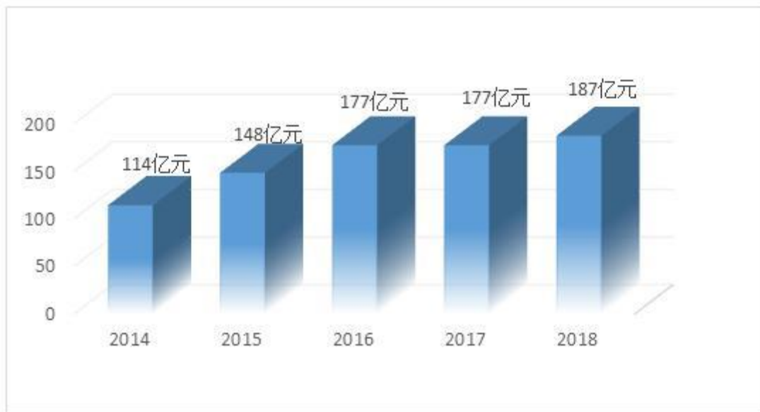
图 4: 近 5 年现代职业教育质量提升计划投入情况

五是品牌活动更有影响。职业教育社会环境不断优化，发展理念、模式和成就广受国内外赞许。自 2015 年起，每年举办职业教育活动周，让社会了解和支持职业教育。连续举办 11 届全国职业院校技能大赛，五年来累计超过 6 万人次参加总决赛。连续举办 13 届中等职业学校“文明风采”活动，2018 年有超过 392.1 万学生参加。定期发布高职质量年报和全国中等职业学校就业分析报告。