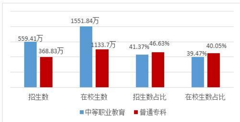
图 1:2018 年招生和在校生情况

一是发展规模世界最大。2018 年，全国有职业院校 1.17 万所；中等职业教育 1 和普通专科招生 928.24 万人，在校生 2685.54 万人。其中，全国中等职业教育共有学校 1.03 万所，高职（专科）院校 1418 所。中等职业教育招生 559.41 万人，在校生 1551.84 万人，招生和在校生分别占高中阶段教育 2 的 41.37%、39.47%；普通专科招生 368.83 万人，在校生 1133.7 万人，招生和在校生分别占普通本专科的 46.63%、40.05%。广泛开展各类培训，每年培训上亿人次。职业教育已经具备了大规模培养技术技能人才的能力，为国家经济社会发展提供了不可或缺的人力资源支撑。